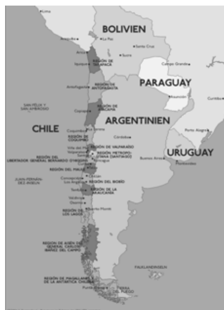
Bild: Landkarte von Südamerika